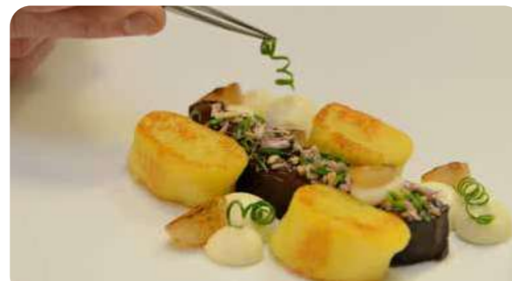
Echte Handarbeit: Stets frisch und mit Liebe zubereitet.

Ein Fachmann aus der Region kümmert sich um das Tierwohl, gute Preise für die Landwirte und die Verfügbarkeit des Fleisches. Eine Metzgerei im Meisterbetrieb sichert die Qualität des Fleisches.