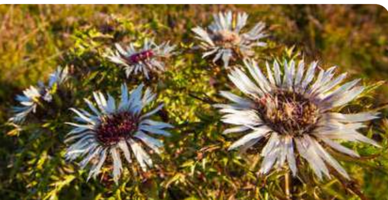
Die Silberdistel ist eine seltene und geschützte Pflanze. Häufig kommt sie da vor, wo Hinterwälder Rinder weiden.