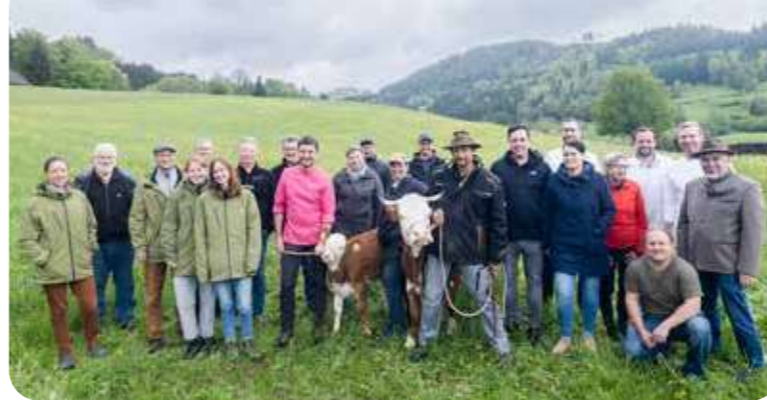
Die Initiative beieinander: Mittlerweile ist die Gruppe noch größer geworden.