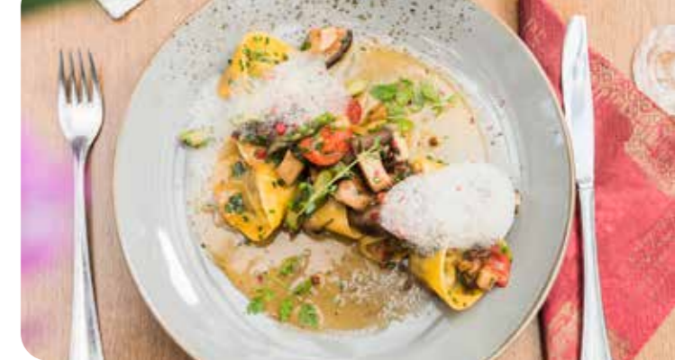
So is(s)t Naturschutz: Guten Appetit!