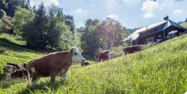
Gut angepasst: Nicht zu groß, nicht zu schwer und geschickt auf den Beinen.